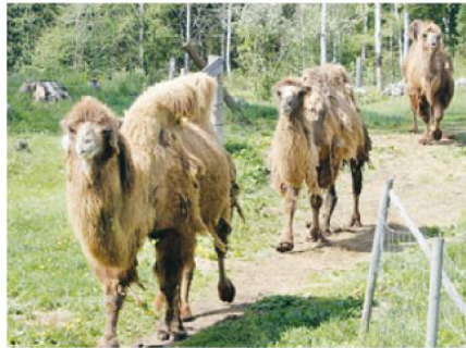
De tre baktriska kamelerna Anna, Kalle och deras son Karlsson finner man i Gamla Viken, på väg mot Nora från Karlskoga räknat.

– De baktriska kamelerna är de mest tåliga och ursprungliga djur man kan