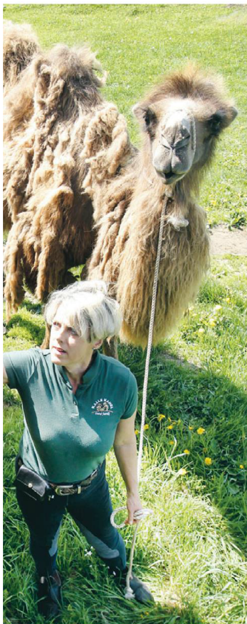
anser är de mest tåliga och ursprungliga djur man kan hitta.