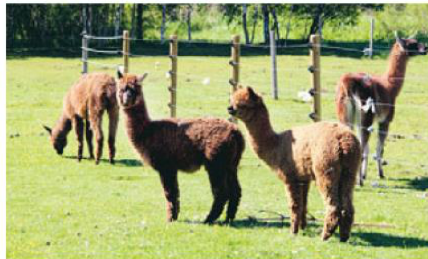
Mindre kameldjur, som alpackor och lamadjur kan man se om man åker till Högberg. Gården ligger intill dressinbanan.